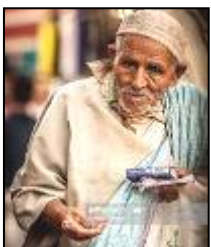
Un homme du Maroc

Plus de 23.6 Million de personnes parlant l'Arabe habitent le pays du Maroc situé au Nord-Est de l'Afrique et constituent le plus grand groupe ethnique non-atteint du Continent. Leurs ancêtres sont venus du désert arabe il y a maintenant plusieurs siècles. Ils sont pour la plupart des fermiers et cultivateurs dont 91.0 % sont Islamiques. Seulement 9 personnes sur 10 000 Marocains professent une foi en Christ.