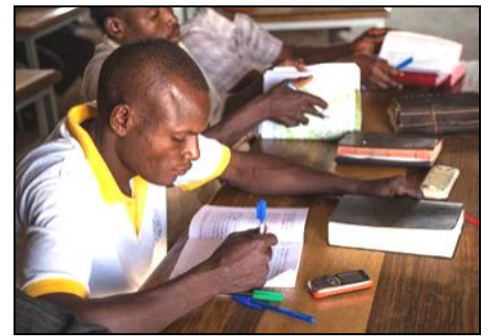
La formation ointe de l'Esprit est la clé de la mobilisation de l'Église pour l'œuvre missionnaire efficace.

Ce mois-ci, nous prions encore une fois pour les 320 (ou plus) Écoles Bibliques et Centres de Formation Pastorale des Assemblées de Dieu en Afrique. Nous implorerons notre Dieu de déverser Son Esprit sur elles, de les oindre et les rendre efficaces pour la formation de « serviteurs de Dieu compétents selon l'Esprit » pour diriger les assemblées et avancer le Royaume de Dieu partout en Afrique.