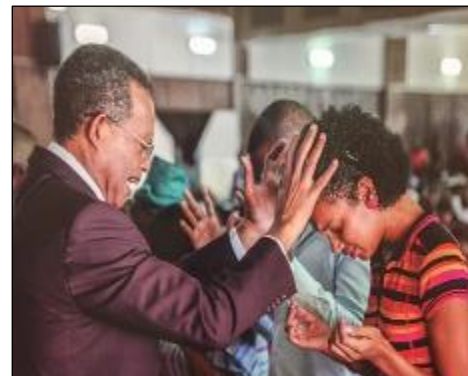
Les Assemblées de Dieu de l'Afrique comptent plus de 320 établissements de formation pastorale à travers le Continent.

— Dr. Denny Miller, Directeur-Initiative: Actes en Afrique