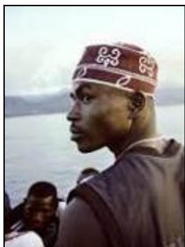
Seulement .25% des résidents des Comores connaissent Christ comme Sauveur.

L'Union des Comores se compose de quatre îles à l'Est de la Côte de l'Afrique. Ces îles sont surpeuplées d'environ 820 000 habitants qui sont presque tous Musulmans. Pas plus de .25% (2.5 personnes pour 1 000) se considèrent Chrétiens .